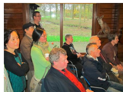
Dick de dichter tussen publiek