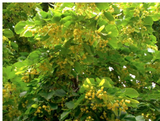
Linde bloesems in overvloed

Dit jaar hebben wij voor het eerst pure linde honing geogst, dankzij de rijk bloeiende lindebomen aan de Schaapweg rond de bijenstand in Steenvoorde. Deze honing heeft een licht groenige kleur en haar medicinale smaak vergeet je niet na de eerste keer proeven.