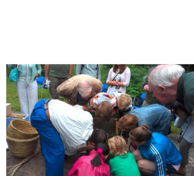
Samen kijken in de observatiekast