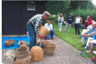
Ab over de korven en kasten