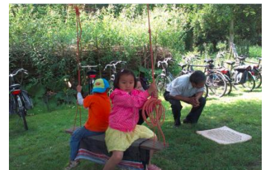
schommelstoelen vaak bezet