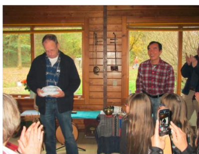
Henk met vreemd geld aan Long