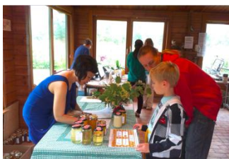
Jonge honing fijnproever

Elk jaar, voor het begin van de zomervakantie, organiseren wij de zomer opendag. Het is dan altijd tevens de landelijke imkerijdag, dit jaar viel het op 14 juli (quatorze Juillet!). Een prachtige, zonnige dag.