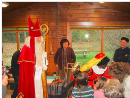
Sint en zwarte Piet op bezoek