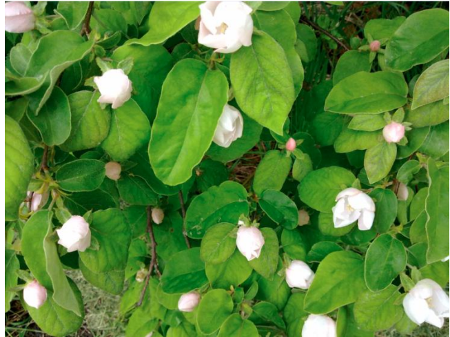
kweeper in bloei voorjaar

Tenslotte mag vermeld worden dat wij de bijenwas steeds zuiverder weten te winnen van de oude raten. En de kunst van het kaarsen dompelen krijgen wij steeds beter onder de knie. Kortom, onze zelfgemaakte kaarsen branden fijner en zien er beter uit!