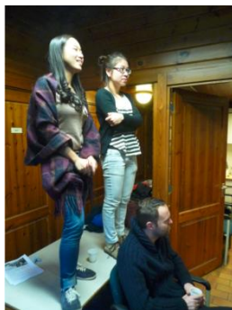
geen stoelen meer