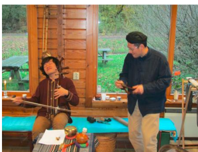
the Young horse song