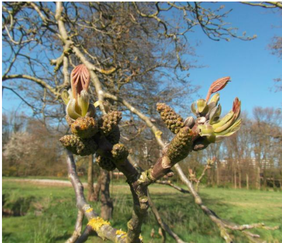
Walnootboom in bloei voorjaar

Er is ook een mooie walnootboom. In de herfstmiddagen is het een vreugde om rond deze boom te lopen en de noten te mogen rapen. Het besef dat dit ritueel al duizenden jaren tot het overlevingspakket van mensen overal ter wereld behoort zette mij soms spontaan tot een buiging aan de walnootboom. Dit jaar maakten wij voor het eerst pasta: fijn gemalen walnoten gemengd met acacia honing. Heerlijk om samen met een stuk kaas op een cracker of boterham te eten.